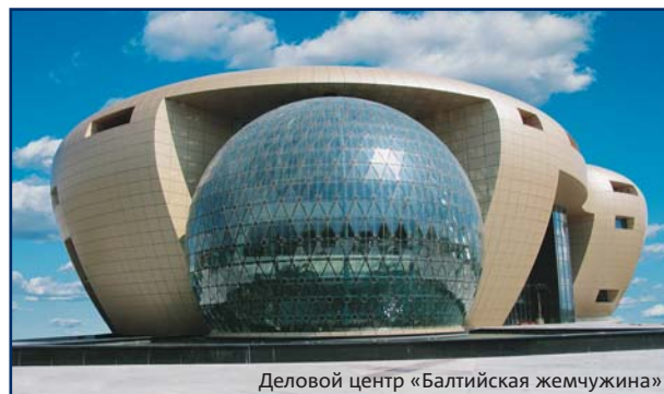
Деловой центр «Балтийская жемчужина»